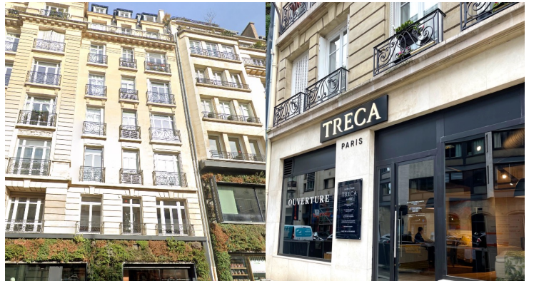
PASSY/PAUL DOUMER - PARIS 16 Vente de 373 m 2 d'un INVESTISSEUR PRIVÉ à un INVESTISSEUR PRIVÉ Sale of 373 sqm from a PRIVATE INVESTOR to a PRIVATE INVESTOR