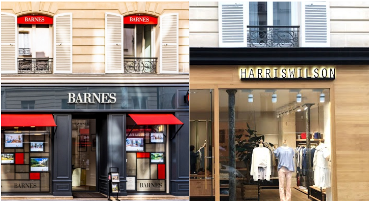
18-24 RUE DE CHARONNE - PARIS 11 Vente de 5 commerces d'une surface totale de 1 174 m 2 de KANAM à un INVESTISSEUR PRIVÉ Sale of 5 retail units with a total area of 1 174 sqm from KANAM to a PRIVATE INVESTOR