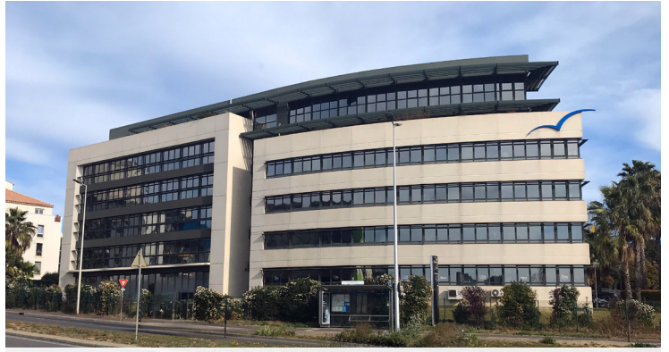
125 RUE DE GILLES MARTINET - MONTPELLIER (34) Vente de 4 500 m 2 de bureaux de GRAND M à NOVAXIA Sale of 4 500 sqm of offices from GRAND M to NOVAXIA