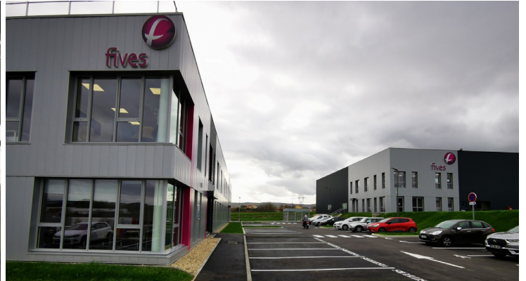
FIVES INFRALOGISTICS - CHASSE-SUR-RHÔNE (38) Vente de 6 200 m 2 de bureaux et surfaces d'activité de FIVES à PAREF Sale of 6 200 sqm of office space and activity surfaces from FIVES to PAREF