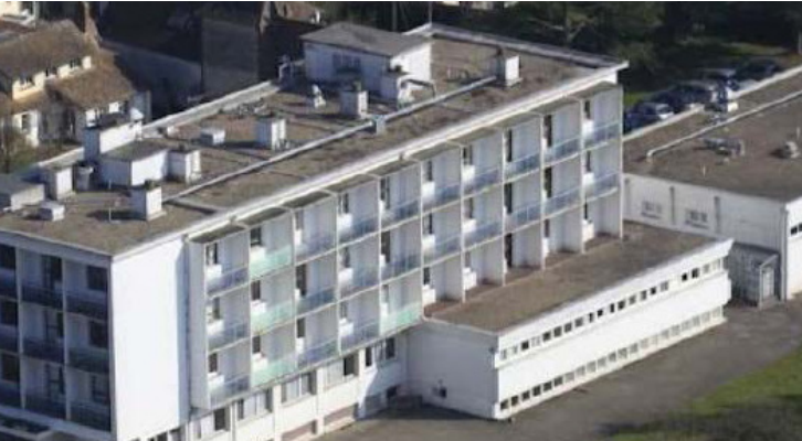
50 RUE DE LA RAVINE - LOUVIERS (27) Vente de 4 500 m 2 de COFINIMMO à CASSOPIÉE Sale of 4 500 sqm from COFINIMMO to CASSOPIÉE