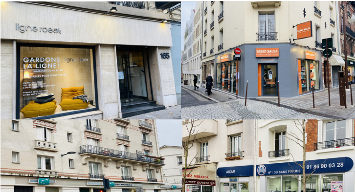
PORTEFEUILLE COLLIERS - ILE-DE-FRANCE Vente de 4 actifs de 470 m 2 de COLLIERS GI à un INVESTISSEUR PRIVÉ Sale of 4 assets of 470 sqm from COLLIERS GI to a PRIVATE INVESTOR