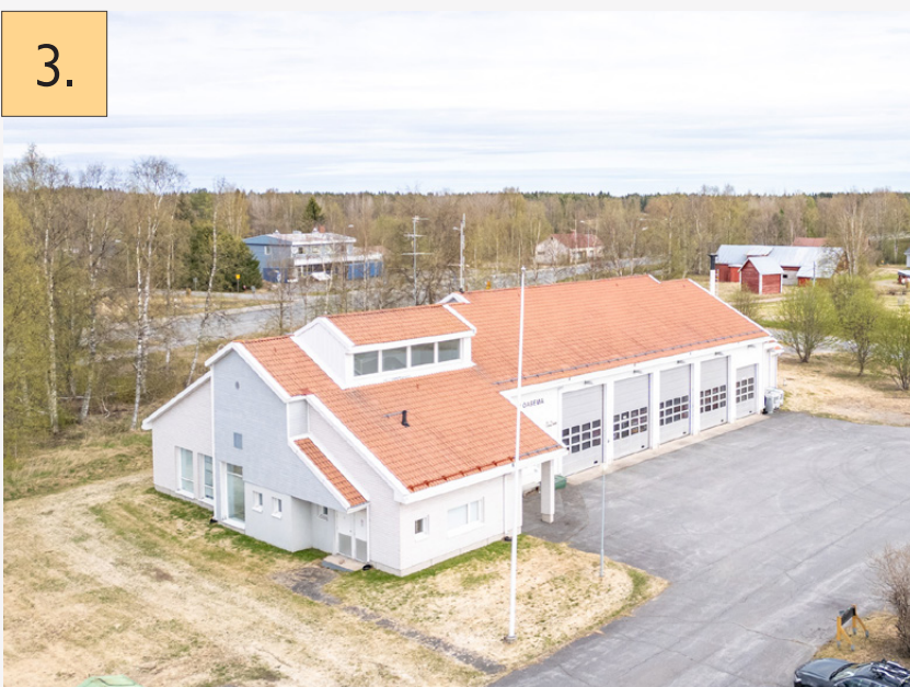
3. Yli-lin paloasema Kirkkokuja 1, Oulu