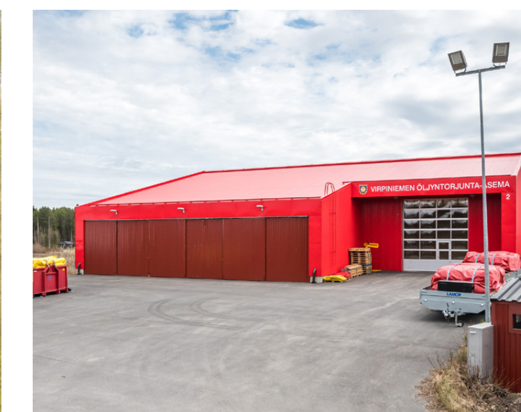
Virpiniemen öljyntorjunta-asema Mustakarintie 80, Oulu