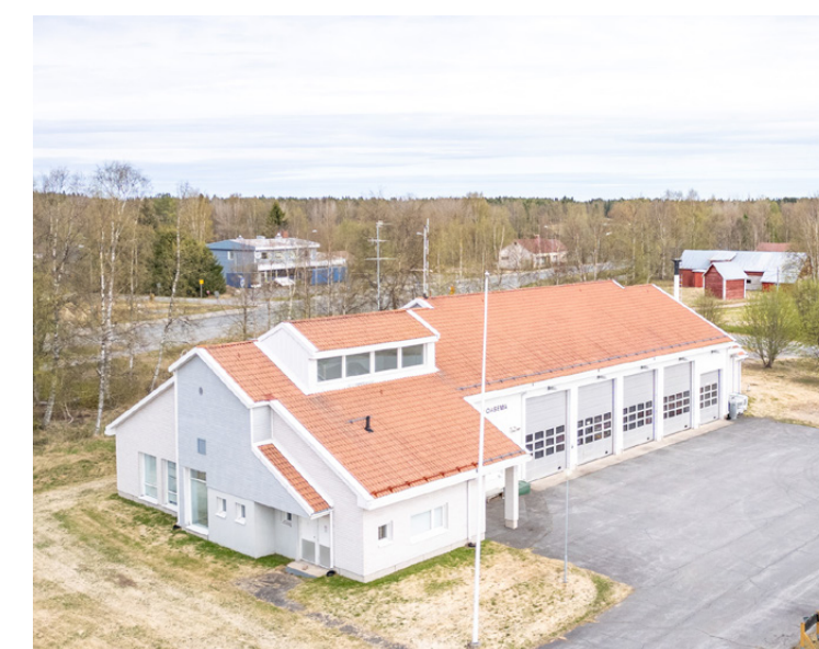
Yli-lin paloasema Kirkkokuja 1, Oulu