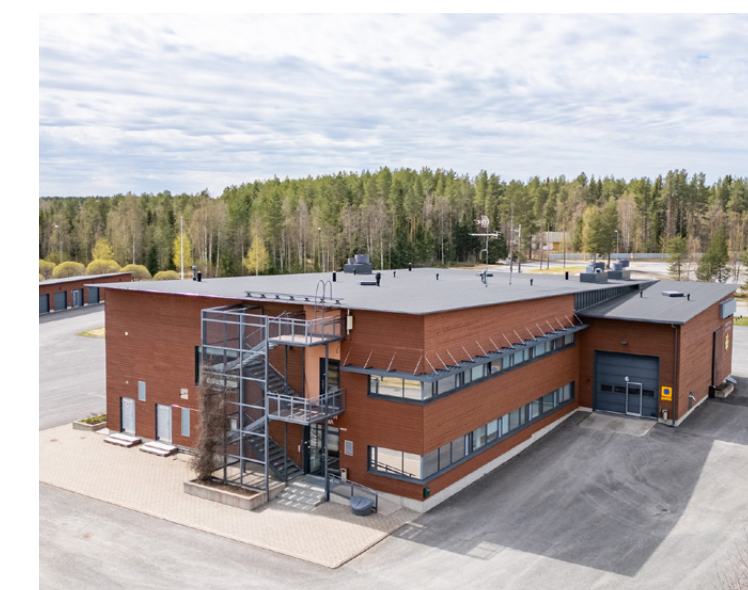
Haukiputaan paloasema Heitontie 1, Oulu