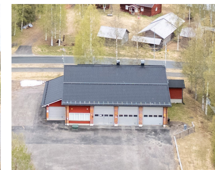
Ylikiimingin paloasema Metsätalontie 2, Oulu