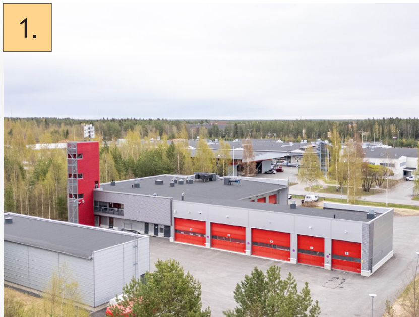
1. Ruskonselän paloasema Tapsitie 4 B, Oulu