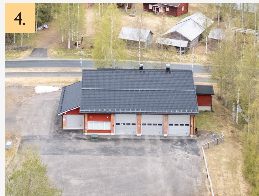
4. Ylikiimingin paloasema Metsätalontie 2, Oulu