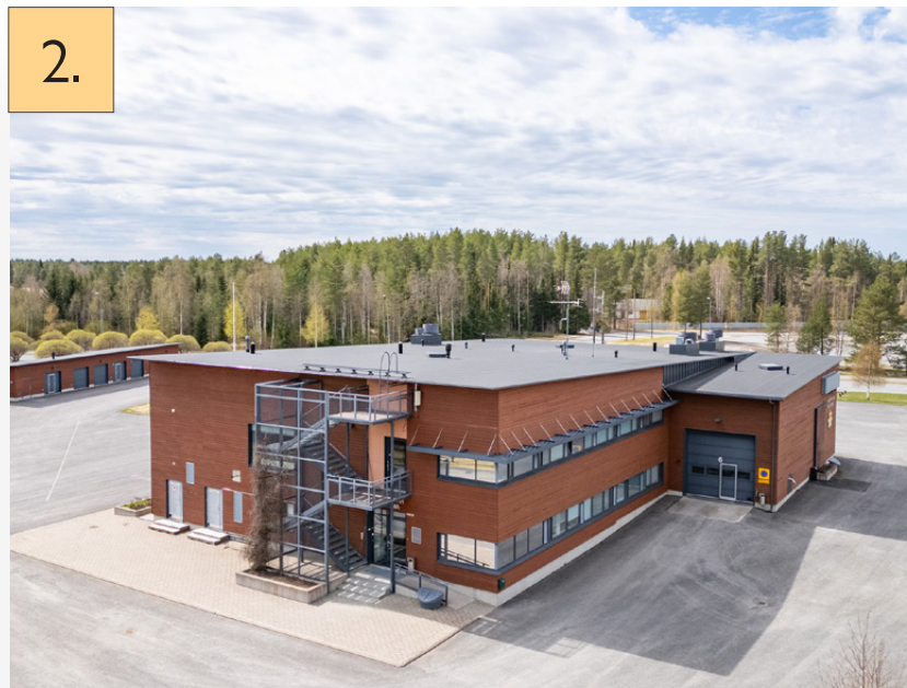
2. Haukiputaan paloasema Heitontie 1, Oulu