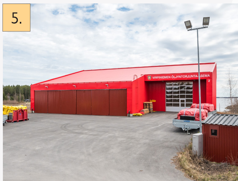
5. Virpiniemen öljyntorjunta-asema Mustakarintie 80, Oulu