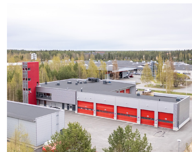
Ruskonselän paloasema Tapsitie 4 B, Oulu