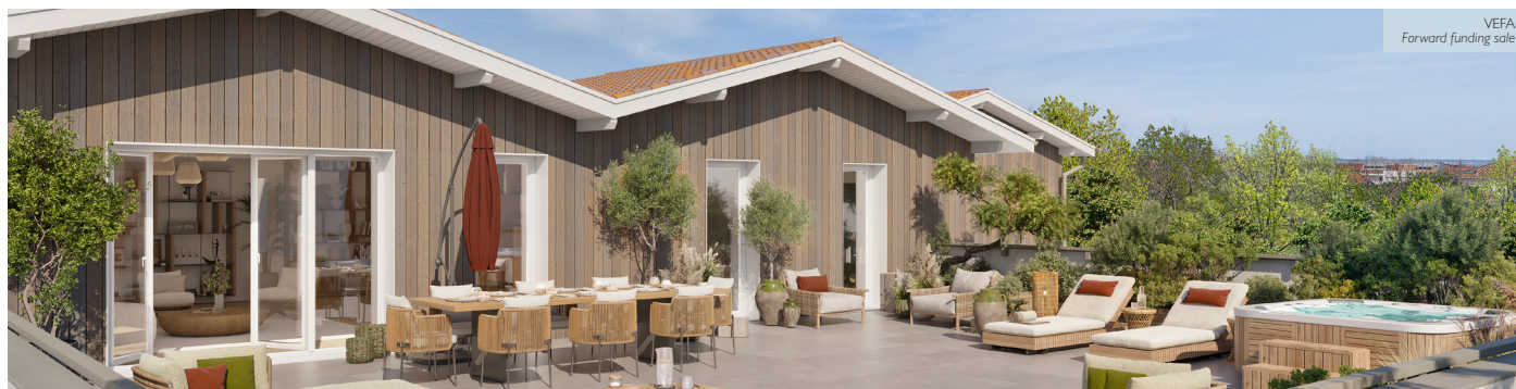
ASSALIDA - LA TESTE-DE-BUCH (33) 28 logements dans le centre-ville de La Teste de Buch 28 apartments in the city center of La Teste de Buch