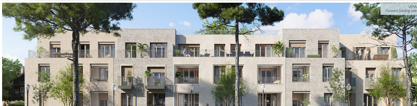
RIVES DU MAIL - LA ROCHELLE (17) 32 appartements face à l'Océan 32 apartments facing the ocean