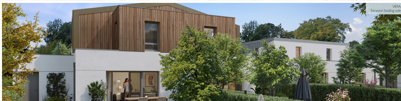
LE DOMAINE LAFAYETTE - ANGERS (49) 72 maisons et appartements à 10min de la gare TGV 72 houses and apartments 10 minutes from the TGV train station