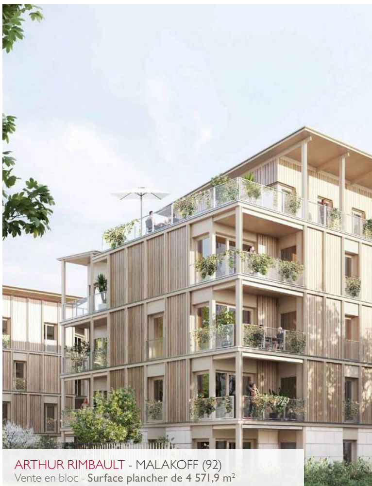
ARTHUR RIMBAULT - MALAKOFF (92) Vente en bloc - Surface plancher de 4 571,9 m 2