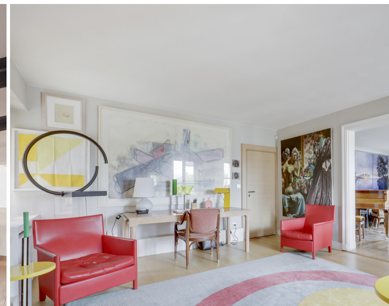
3 QUAI MALAQUAIS - PARIS 6 Appartement - 150 m 2