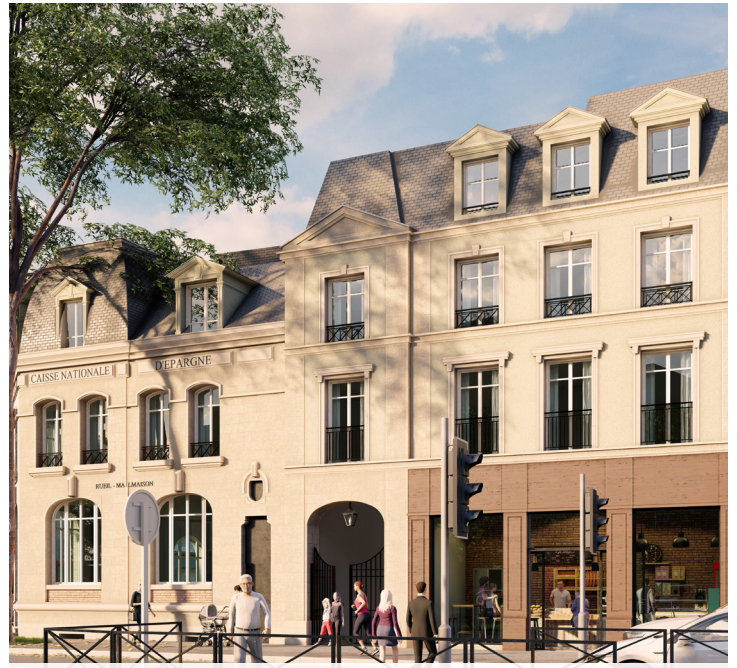
EMBLEME - RUEIL-MALMAISON (92) 47 lots