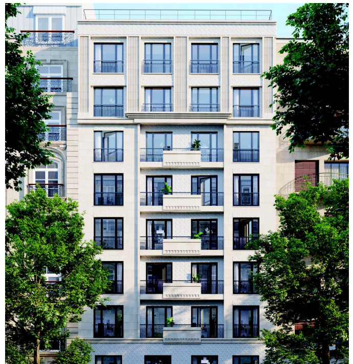
GALERIE PERETTI - NEUILLY-SUR-SEINE (92) 3 logements en nue-propriété (usufruit de 17 ans)

Catella Patrimoine believes in the democratization of bare ownership to reach a wider client base. We are implementing this strategy on newly built and existing real estate properties. Our bare ownership offers are available on catellapatrimoine.fr .