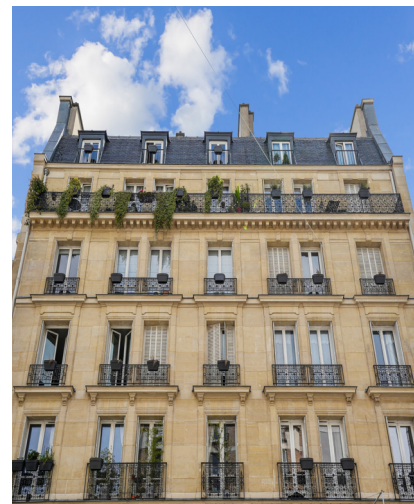
101 - 103 LE COURBE - PARIS 15 Vente en bloc - 2 008,26 m 2