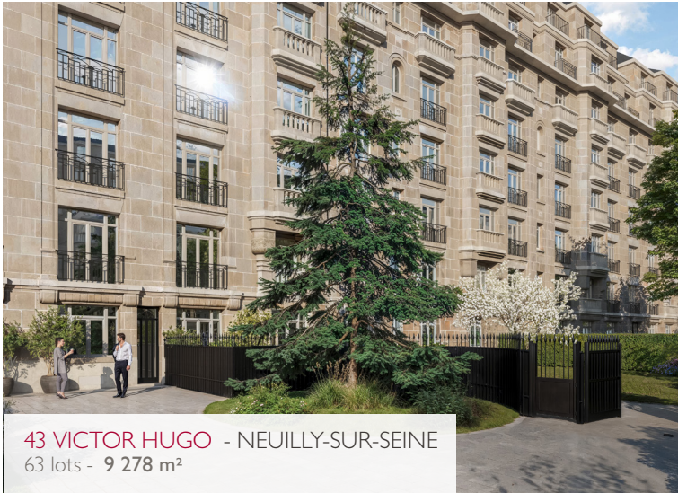
43 VICTOR HUGO - NEUILLY-SUR-SEINE 63 lots - 9 278 m 2

Leader in sales before completion on the Parisian real estate market, Catella Residential Partners had to complete its offer with the launching of Catella Real Estate France: a department which will focus on sales of existing prestige Parisian real estates. High end, tailor-made customer service, exceptional locations, magnificent views, charming Parisian architecture... Our experienced team is determined to conquer shares in the luxury market segment.