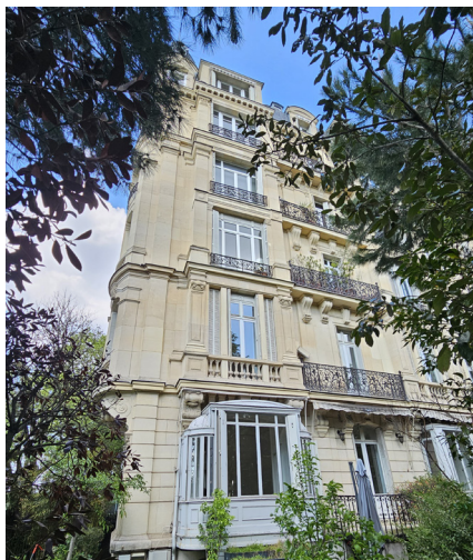
77 LANNES - PARIS 16 Vente en bloc - 701,1 m 2

Our team will advise these groups in terms of strategy development for sales or acquisitions, and will support them through each step of the process until the transaction has been finalised.