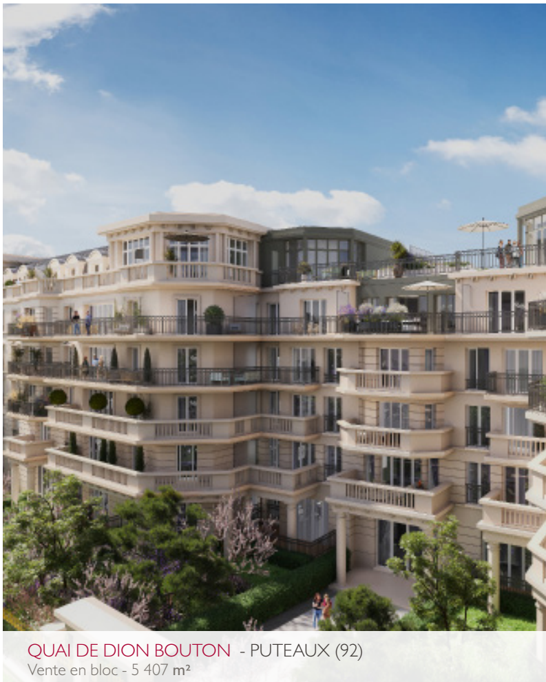
QUAI DE DION BOUTON - PUTEAUX (92) Vente en bloc - 5 407 m 2