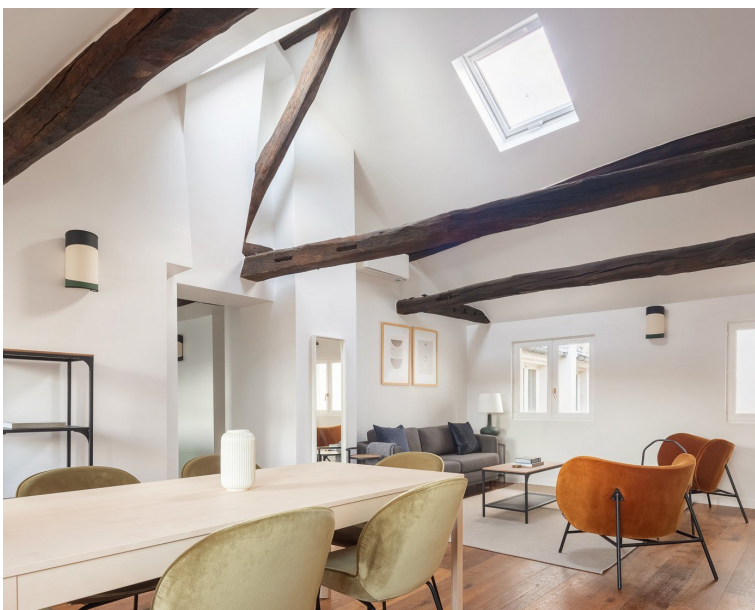
31 PLACE DU MARCHÉ SAINT HONORÉ - PARIS I Appartement - 75 m 2

After assessing and adding value to the asset, Catella Residential will initiate all the preparatory steps needed for getting the site on the market (i.e., rental analysis, collective co-ownership, diagnostics, etc.). We also take responsibility for all legal requirements, as well as developing the most appropriate marketing and communication tools for each asset.