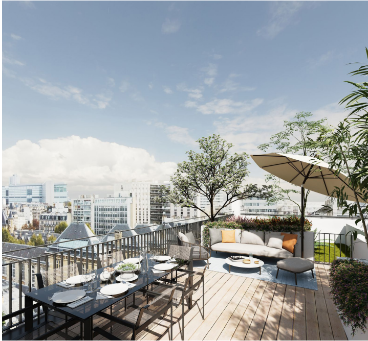
17 FAUBOURG - PARIS 15 16 lots

We have several dedicated teams in our sales offices, as well as teams specifically focused on recommendations thanks to our sales platform catellaresidential.fr . With the help of our back office team and our sales follow-up, we ensure that our clients receive a service that is tailored to their needs.