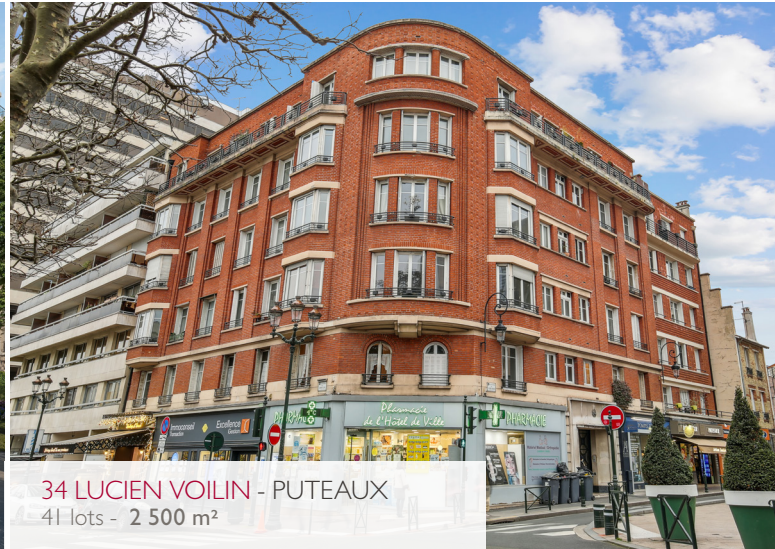
34 LUCIEN VOILIN - PUTEAUX 41 lots - 2 500 m 2

Pour le compte de propriétaires institutionnels ou privés mais également d'opérateurs ou marchands de biens, Catella Residential prend en charge l'intégralité du processus de commercialisation lot par lot d'immeubles ou portefeuilles d'immeubles à dominante résidentielle ou mixte.