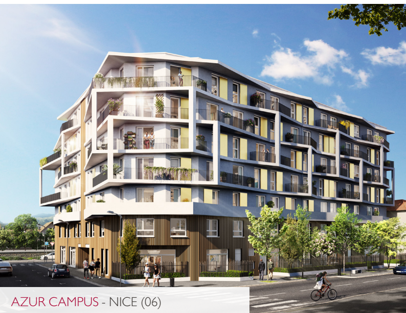
AZUR CAMPUS - NICE (06)