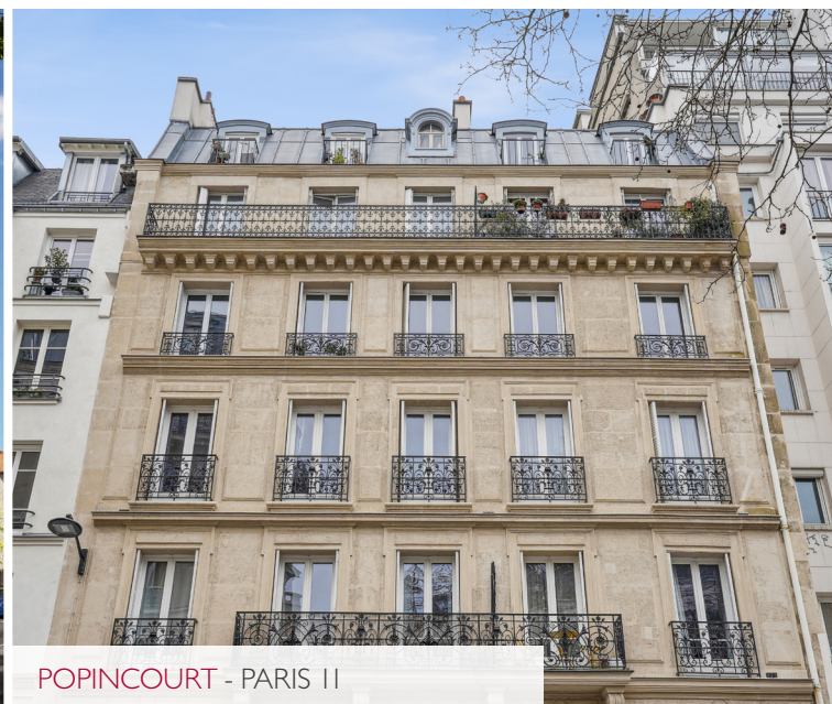
POPINCOURT - PARIS 11